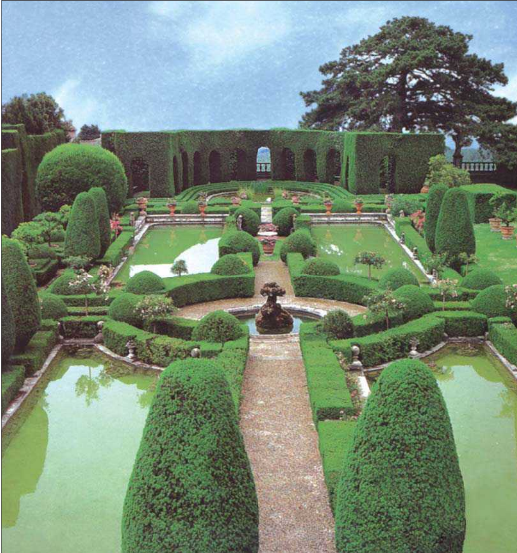
5 pav. Vila Gamberaja, esanti Florencijos priemiestyje, yra viena iš žaviausių vietų pasaulyje, sukurtų XV a. Ją supantis Princų parkas laikui bėgant tapo unikaliu pagal žmogaus užgaidas perkurtos gamtos pavyzdžiu

Fig 5. Villa Gamberaia, situated in the outskirts of Florence, is one of the most enchanting places in the world, created in the 15th century. The Park of Princes around the villa is extorting the nature according to the caprices of the man