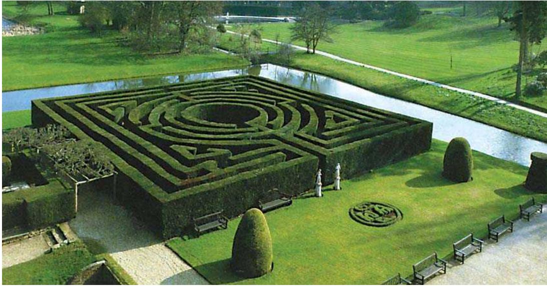
9 pav. Karpyto kukmedžio gyvatvorės labirintai – pagoniškiųjų tradicijų atspindys XX a. pradžios Anglijos sodininkystėje – iliustruoja plačias figūrinio medžių karpymo meno galimybes

Fig 9. Mazes of topiary yew-tree hedges is a recurrence of the pagan ritual of the English horticulture at the beginning of the 20th century. It is an illustrative example of wide usage possibilities of topiary art