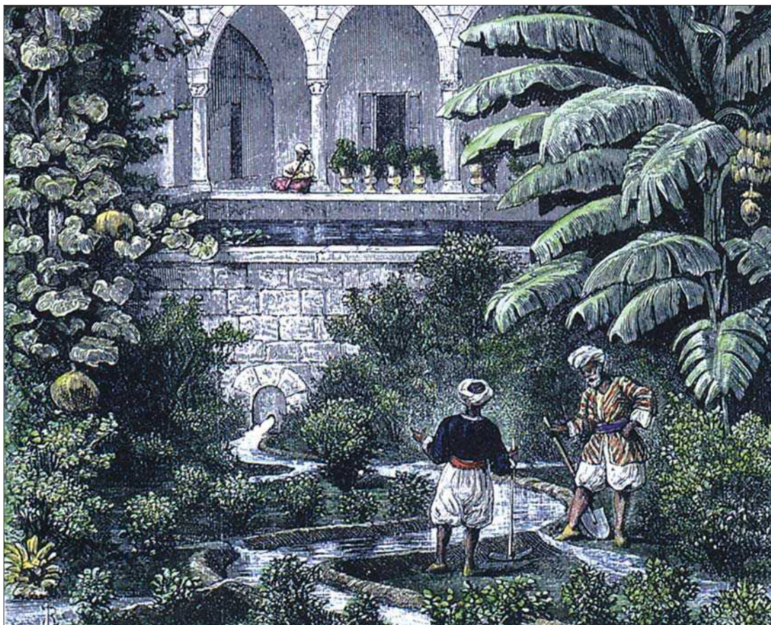
2 pav. Rojaus sodai, įveisti islamo užkariautojų Persijoje apie 637 m. po Kr., buvo dvasinės ramybės oazės, sukurtos laikantis Korano žodžių: „Šiame pasaulyje neturi būti sodų ir upių, jeigu jie nėra tokie, kokie buvo rojaus sodai ir upės“ Fig 2. The Paradise gardens, created by Islamic conquerors in Persia in 637 A.D., were the oasis for soul, created according to the words of Koran: „There would be no gardens in this world or rivers if it were not for the Gardens and Rivers of Paradise“.