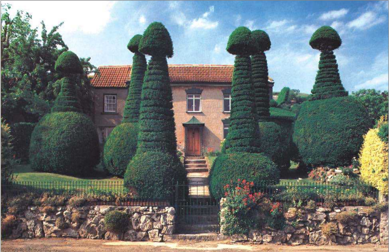
7 pav. Privataus kotedžo teritorijoje išlikęs figūrinio medžių karpymo pavyzdys Anglijoje netoli Bristolio. 1842 m. sodinti ir nuolat karpymu formuojami medžiai siekia iki 5 m aukščio ir savo unikalumu bei egzotika vilioja turistus

Fig 7. Example of pruned plants in the land plot of private cottage in England, near Bristol. Planted in 1842 and constantly formed by clipping, the trees are 5 m tall unique and exotic plants attracting a lot of tourists