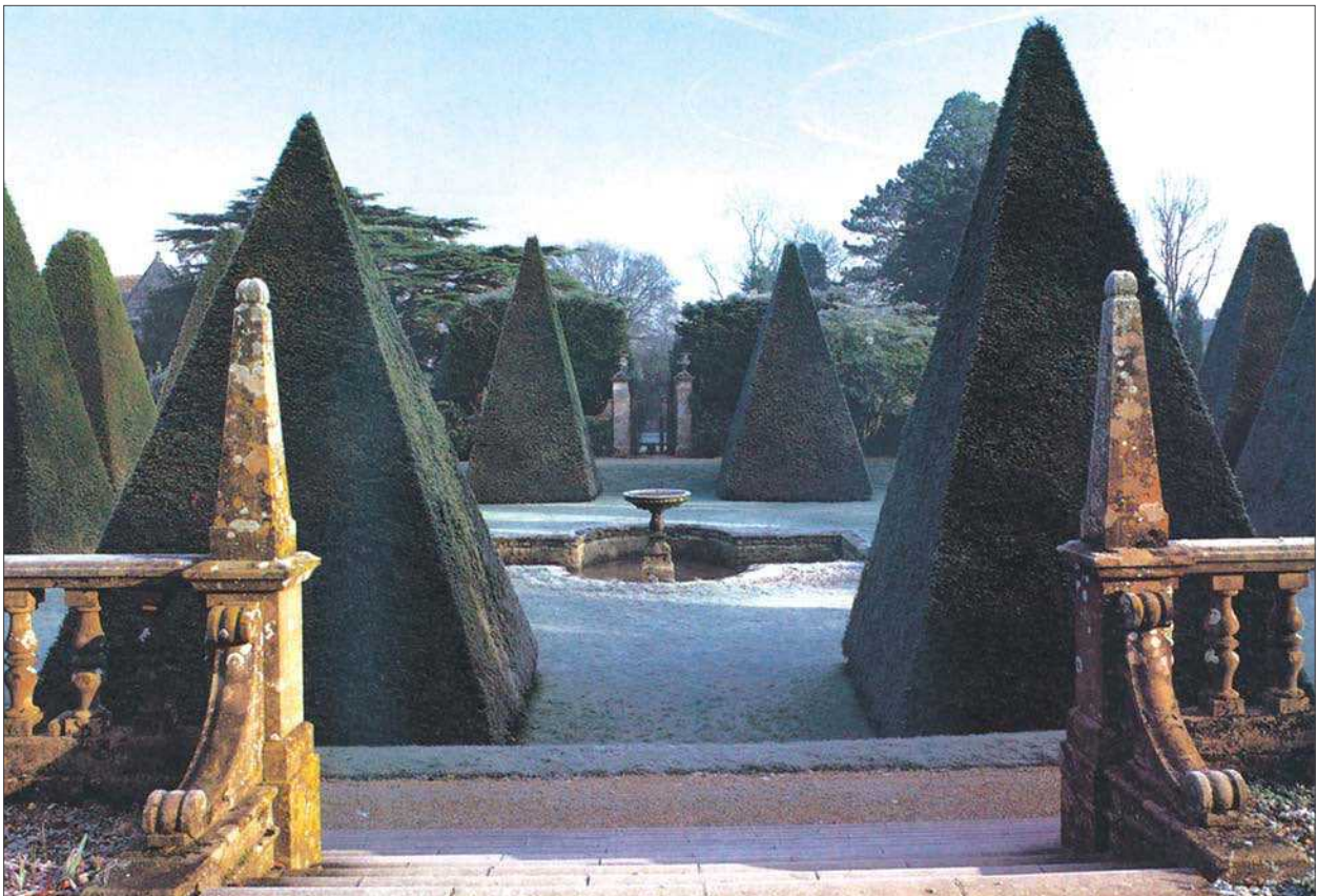
8 pav. Figūrinis medžių karpymas suteikiant jiems piramidės geometrinę formą ypač išpopuliarėjo Anglijoje XIX a. pabaigoje

Fig 7. Example of pruned plants in the land plot of private cottage in England, near Bristol. Planted in 1842 and constantly formed by clipping, the trees are 5 m tall unique and exotic plants attracting a lot of tourists