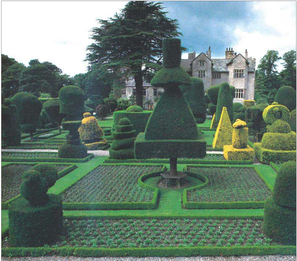
6 pav. Levens Hall parkas-sodas yra tikras figūrinio medžių karpymo meno laimėjimas Anglijoje XVII–XVIII a. Fig. 6. Levens Hall orchard-park demonstrates achievements of the topiary art in England of the 17th–18th centuries